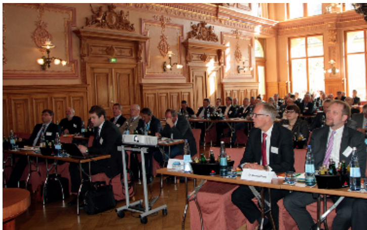
Schwerpunktthema war das Selbstverständnis der Winzergenossenschaften und ihr Image.

Tourismus Marketing GmbH Baden-Württemberg, berichtete über das mittlerweile hervorragende Image genossenschaftlicher Weine. Auch in der Podiumsdiskussion bestand bei allen Diskutanten Einigkeit, dass die genossenschaftlichen Weine von hervorragender Qualität sind und keine Konkurrenz scheuen müssen. Insgesamt sieht sich die genossenschaftliche Weinwirtschaft gut