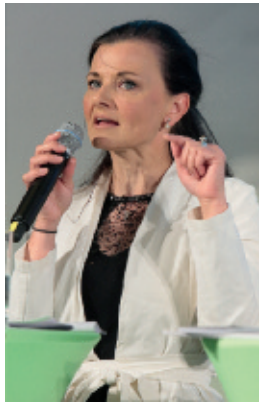
Gitta Connemann Stellv. Vorsitzende der CDU/CSU- Bundstagsfraktion

Wertschätzung für Lebensmittel zu schaffen, das ist eine politische Aufgabe.