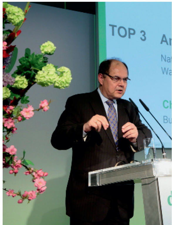
Ein Import- oder Nutzungsverbot für GVO-Futtermittel kommt für Bundesminister Christian Schmidt nicht infrage.

Für den Bundesminister ist der weitere Ausbau des Exports Chefsache. Dabei schließt er auch in Zeiten niedriger Weltmarktpreise Subventionen für Ausfuhren grundsätzlich aus. „Für den erfolgreichen Abschluss der TTIP-Verhandlungen müssen wir entschlossen streiten. Denn wir wollen grundsätzlich nicht zu Hintersassen bei Handelsabkommen werden“, betonte der CSU-Politiker. Er setzt sich mit Nachdruck dafür ein, dass keine Wachstumshormone in der tierischen Veredelung eingesetzt werden. „Produktsicherheit ist nicht verhandelbar. Aber alles, was ein Handelshemmnis darstellt, muss abgebaut werden. Denn wer den Wettbewerb scheut, hat bereits verloren“, gab sich Schmidt kämpferisch.