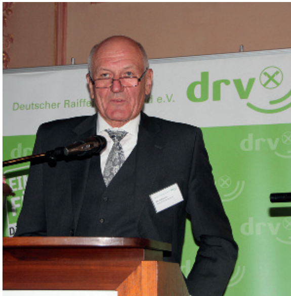
Präsident Manfred Nüssel forderte Nachbesserungen in der Weingesetzgebung.

gerüstet für die steigenden Herausforderungen, insbesondere was den Zuwachs an Rebflächen und die geringer werdende Zahl potenzieller Konsumenten betrifft.