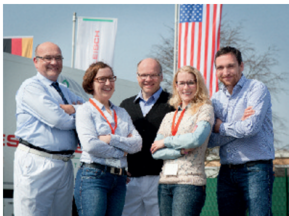
Verantwortliche der WESTFLEISCH eG und des DRV im Meinungsaustausch mit US-Diplomaten.

Der Deutsche Raiffeisenverband hat in den letzten Jahren dazu seine Arbeit intensiviert. Ein regelmäßiger fachlicher Austausch mit den in Deutschland akkreditieren Agrarattachés ausländischer Botschaften ist dabei ein wesentlicher Bestandteil. Marktinformationen spielen diesbezüglich eine eher untergeordnete Rolle. Vielmehr stehen im Fokus die Entwicklungen hinsichtlich der Tierhaltung, des Tierwohls und der Initiative Tierwohl. Zentraler Bestandteil der Gespräche mit Vertretern asiatischer Länder sind Absicherungen der Produktqualitäten.